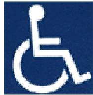
障害者のための 国際シンボルマーク