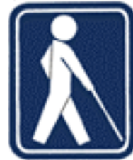
盲人を表示する国際 マーク