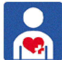
ハートプラスマーク