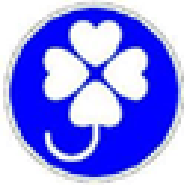
身体障害者標識 (障害者マーク)