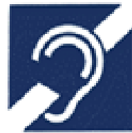
聴覚障害者シンボル マーク (国際マーク)