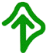
聴覚障害者シンボル マーク (耳マーク)