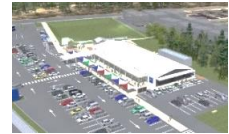
道の駅のと千里浜