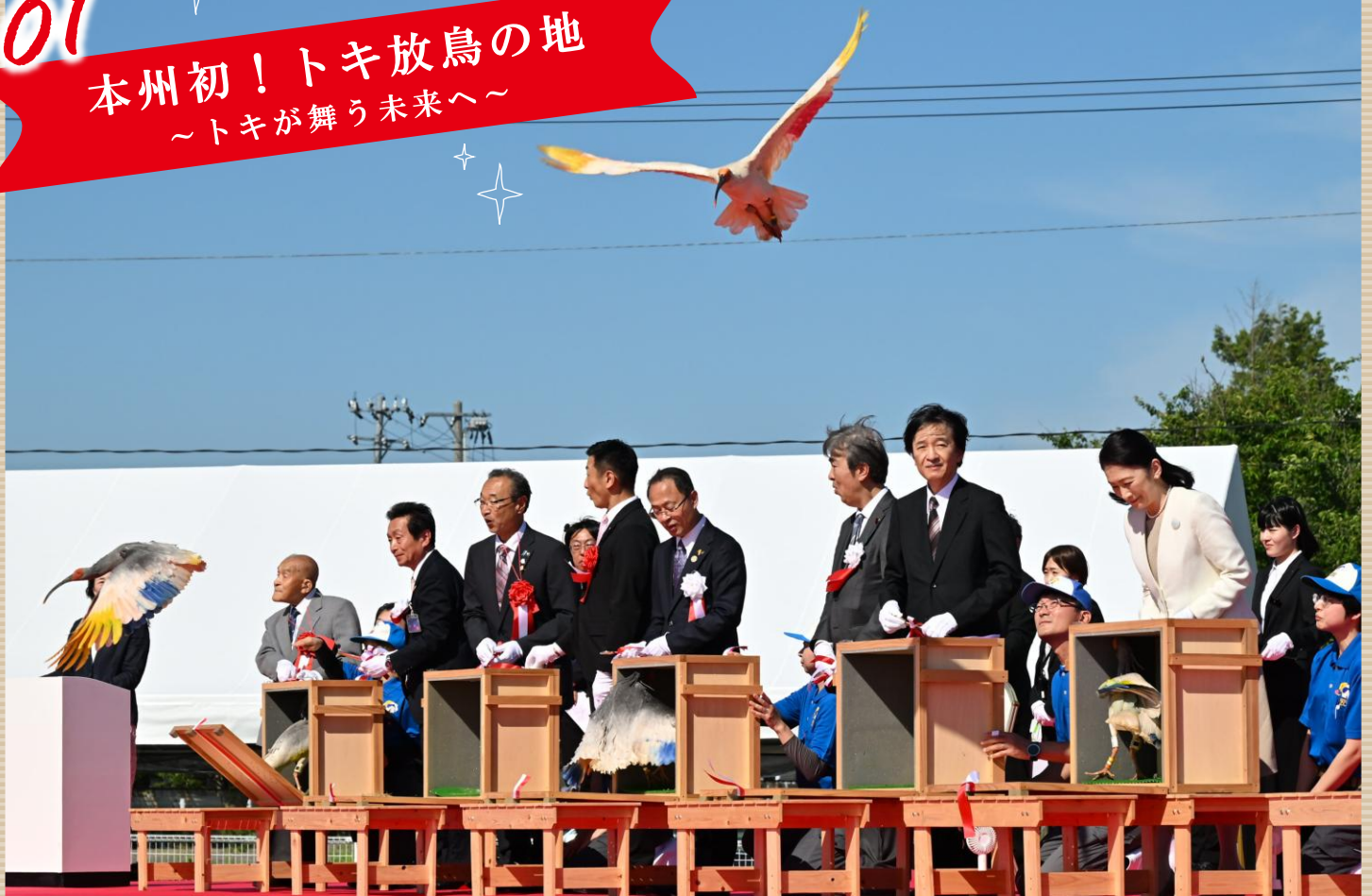
▲令和8年5月31日に行われたトキ放鳥記念式典・放鳥式に、羽咋市も運営に携わりました。