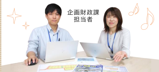
企画財政課 担当者

今後も切れ目なく新たな宅地造成を行い、市外や県外の若い世代に対して魅力ある分譲地の開発を行い、羽咋市への移住定住に繋げていきます！