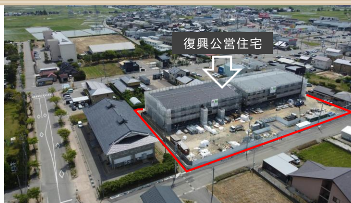
▲令和8年6月、建方工事が完了しました！

令和6年能登半島地震により、「住まい」を失った被災者の生活再建を支援するため、復興公営住宅の整備を進めています。現在、内部工事を実施しており、順調に工事が進んでいます。入居内定者への説明会も開催し、住宅の計画内容や今後の予定をお示しました。令和8年10月からの入居に向けて、ハード・ソフト両面から業務を進めています！