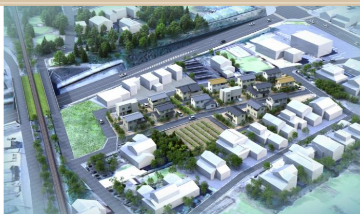
▲「兵庫ヒルズ」完成イメージパース