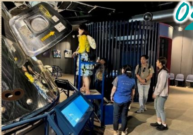
▲FAMツアー：台湾の旅行会社を招待し、羽咋市が持つ観光コンテンツを実際に体験していただきました。