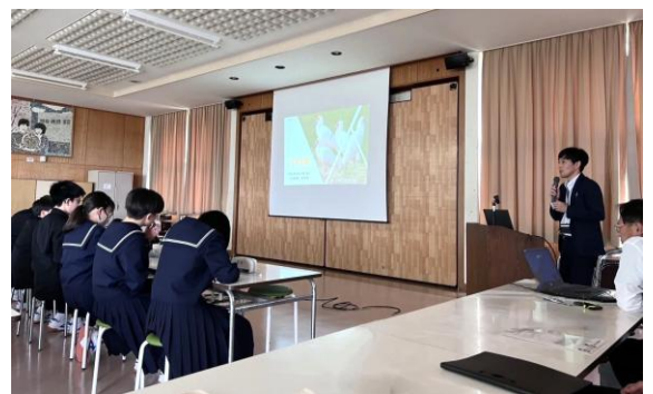
▲市内中学校にて、トキの出前講座を行いました。

令和7年9月、農林水産課内に、関係する複数の課の職員で構成する「トキ共生室」が新設されました。トキの定着・共生に向け、生息状況のモニタリング、環境に配慮した農業の推進及びビオトープ整備を支援しています。また、トキ関連商品への支援やトキ認証米のブランド化を促進し、地域経済の活性化を図っています。市民や子どもたちを対象とした環境学習、普及啓発活動を行い、生物多様性の保全と地域活性化も進めています。トキと共に暮らし、未来へ繋ぐまちづくりを目指します！