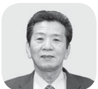
新田 義昭 議員

【答弁】平成29年7月の開業から3年2ヶ月を経過し、レジ通過者の累計は86万8,000人に達している。また、これまでの売上高が10億円に達するなど、運営は順調に推移している。収支についても黒字経営を継続していることから、概ね自立・自走の体制は整っていると考えている。今後については、自立した経営体として、本市の観光情報や特産品などの魅力を発信し、生産・加工・販売を通じ、地域経済の好循環を創生する拠点として運営していく。