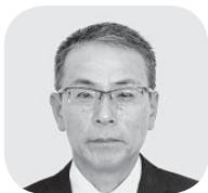
酒井 一人 議員

【答弁】最近の移住相談の傾向としては、能登地方で田舎暮らしをするために理想の空き家を求めるケースが増えている。今年度は市内で空き家の実態調査を行い、良質な物件を把握するとともに、空き家情報バンクへの登録を促すことで有効活用と移住者の住環境整備につなげていきたい。また、オンライン移住相談はスタートしたばかりであるが、今後PRを強化し、積極的にオンラインによる移住相談を実施していく。