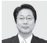
櫻井 英一 議員