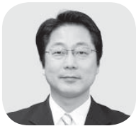
櫻井 英一 議員