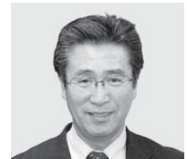
大塚 幸男 議員