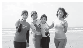
女子サーファー達