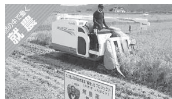
県外からの農業移住者