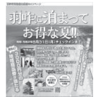
緊急宿泊応援キャンペーンのチラシ