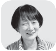
北川 真知子 議員