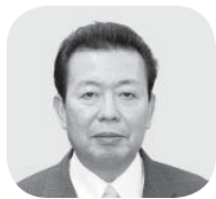
浅野 俊二 議員

【答弁】プロジェクトチームによる対策検討では無く、今後も現場の声を大切にし、学校経営方針や指導方針を生かし、教育委員会が先生と一体となりさらなる向上に取り組む。