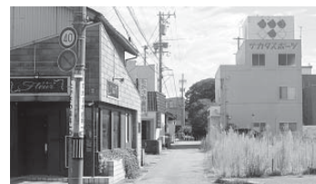
拡幅工事が実施される市道羽咋101号線