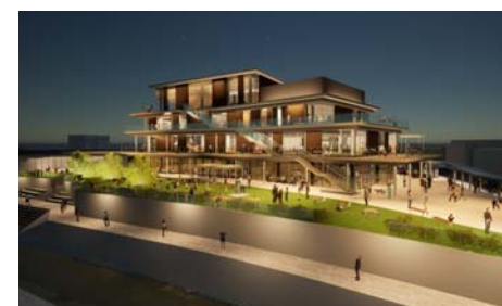
夜間にライトアップされた建物周辺の様子