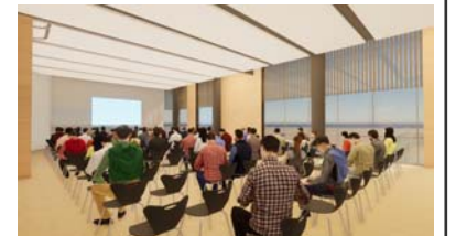
約200席を確保できる多目的ホール（4F）