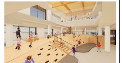
子どもから大人まで楽しめる屋内公園（2F）