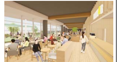
カフェと一体となった図書カフェ・学習スペース（1F）