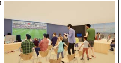
多様な世代が交流するシェアスペース（3F）