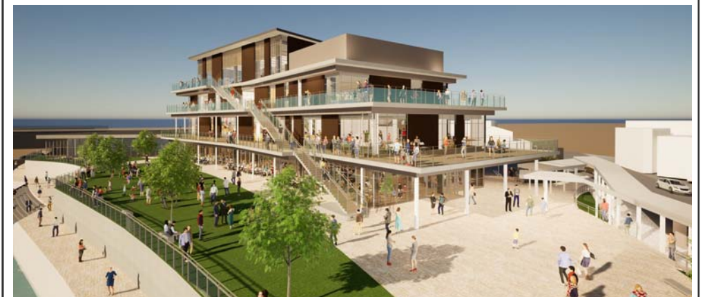
大屋根広場、緑の広場といった外部空間と、各階がテラスによって立体的につながります。