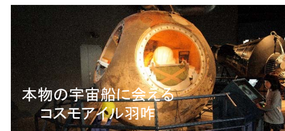
本物の宇宙船に会える コスモアイル羽咋