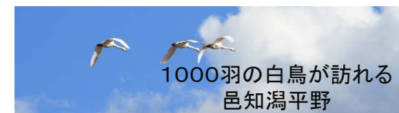
1000羽の白鳥が訪れる 邑知潟平野