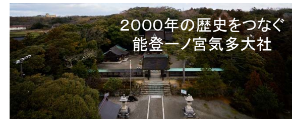
2000年の歴史をつなぐ 能登一ノ宮気多大社