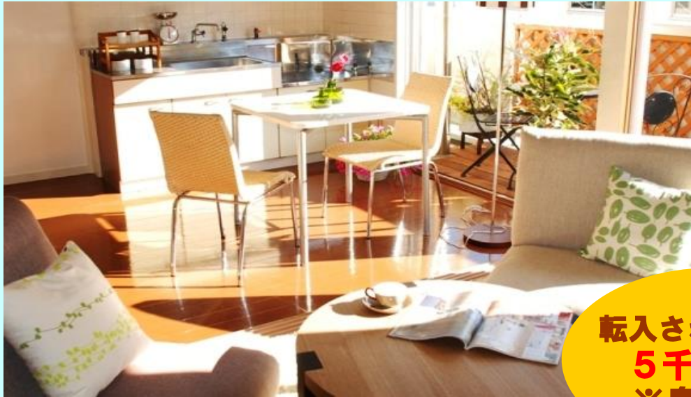
島出住宅に家具を置いて撮影した写真(家具等は付いていません)