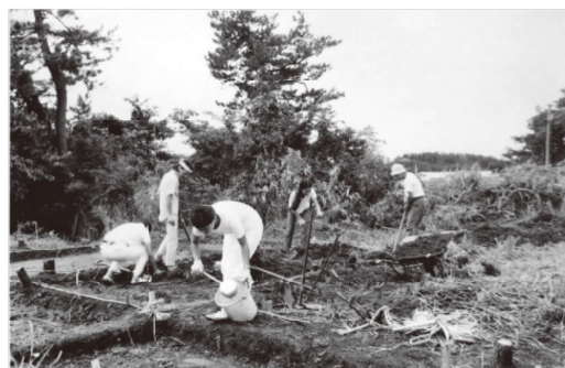
柳田シャコデ廃寺の発掘調査