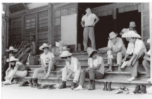
お寺で合宿し、発掘現場に出発する部員たち