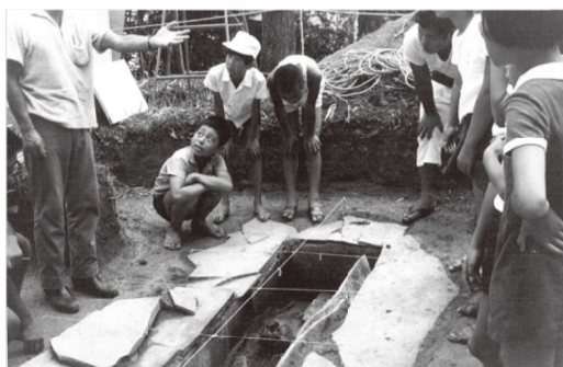
柴垣円山 1 号墳の石室の発掘調査